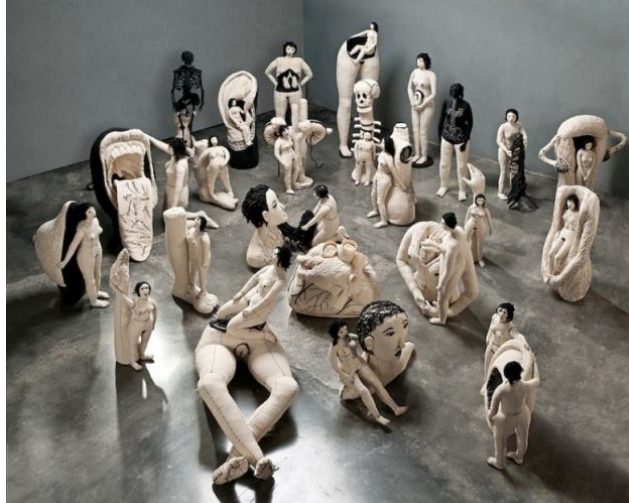
Zurciendo. Catálogo en línea de la artista.