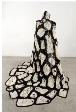
De la serie Vestidos invertidos . Catálogo en línea de la artista.

Para mayor información sobre la artista y su obra, los interesados pueden ingresar a su sitio de Internet en la dirección www.miriammedrez.com .