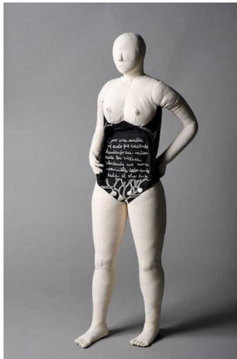
De la serie Lo que los ojos no alcanzan a ver . Catálogo en línea de la artista.