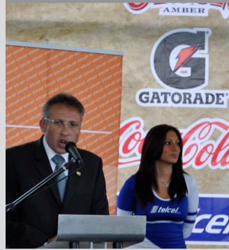
Rueda de prensa con Aztecas