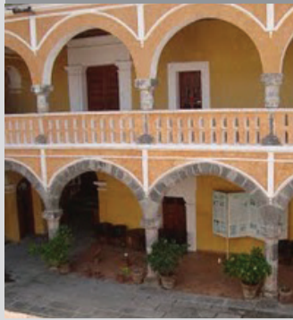
Casa del Caballero Águila