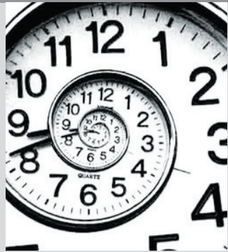
Taller de administración del tiempo