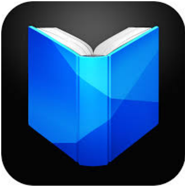
Google Play Books

¿Qué te parecieron estas aplicaciones? ¿Ya utilizas alguna? Cuéntanos tu experiencia con ella, y si hay algo que te gustaría que abordáramos el próximo Jueves de Tecnología, no dudes en compartirlo con nosotros.