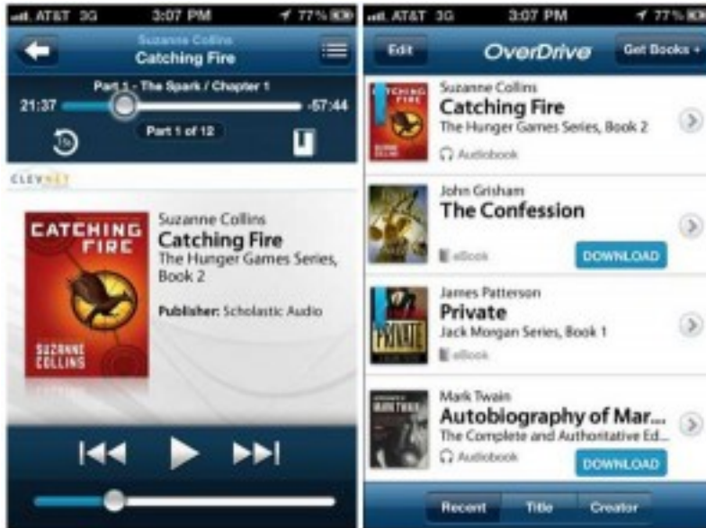
OverDrive Media Console

Pedir libros electrónicos, audiolibros y streaming de vídeo a la biblioteca de OverDrive en tu iPad, iPhone y iPod es fácil y práctico. Más de 30,000 bibliotecas de todo el mundo ofrecen títulos de OverDrive, por lo que descargar la aplicación y encontrar el próximo libro que leer se torna en algo muy sencillo.